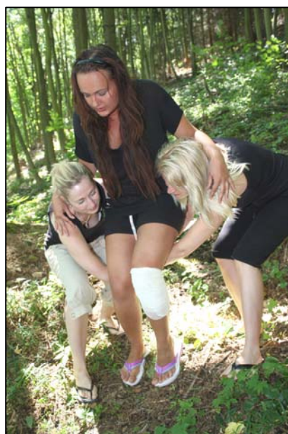
Obr. 3,4: Improvizované sedátko.