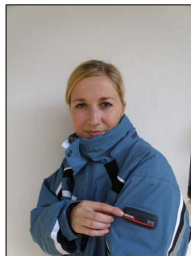
Obr. 5: Bunda vybavená lavinovým vyhledávačem.