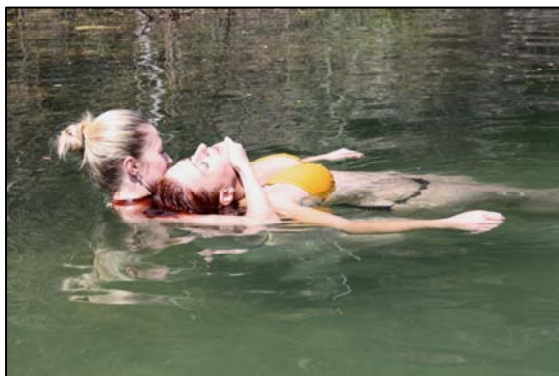
Obr. 6: Před záchranou tonoucího zvažte Vaše schopnosti.