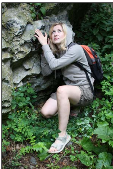
Obr. 2: Vyhledejte vhodné místo na přenocování.

V následující části Vám nastíníme poměrně extrémní případ ztráty orientace v neznámém prostředí, kdy nejste schopni si přivolat pomoc, neznáte cestu zpět do civilizace, a pravděpodobně budete muset v přírodě strávit noc.